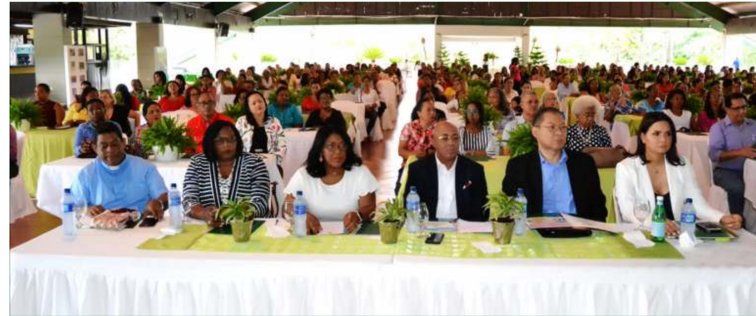
XVIII Congreso de Mujeres Cooperativistas